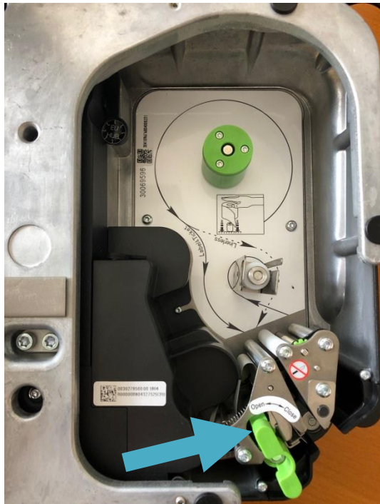
grünen Verschluss entriegeln (OPEN)