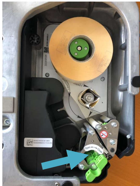
grünen Verschluss verriegeln (CLOSE)

Bitte beachten: Nach jedem Etikettenrollenwechsel ist eine Neujustierung des Sensors notwendig!!!