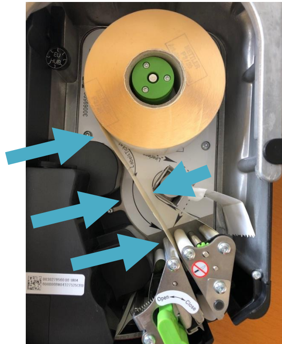
Rolle laut Abbildung „Linerless“ einlegen