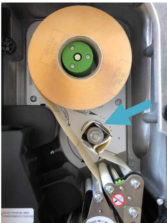
Etikettenende in die Aufwickelwalze einlegen und im Uhrzeigersinn ca. 3 Umdrehungen manuell aufwickeln